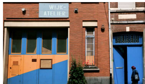
↑ Wijkatelier 2019 Molenbeek-Saint-Jean

L'observation souligne l'importance des possibilités créatives dans les quartiers comme alternative à une expérience culturelle passive. Plutôt que la consommation culturelle, la confiance est accordée au pouvoir de la co-construction culturelle. Ainsi, c'est aux personnes elles-mêmes aux profils socio-culturels variés, de participer à la construction des contenus culturels proposés, ainsi qu'à l'instauration de processus de solidarité dans le quartier et à la réalisation de la citoyenneté.