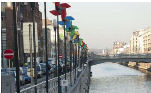
↑ Vue des moulins du canal

À côté de la diversité culturelle, le territoire est également marqué par des inégalités et un manque général d'accès aux institutions culturelles dominantes. Dans un territoire où différentes influences interagissent, la question s'est posée de mieux comprendre comment favoriser les rencontres et comment identifier et affronter les obstacles à la participation culturelle. La combinaison des recherches quantitative et qualitative a permis de saisir la complexité des enjeux culturels des quartiers étudiés.