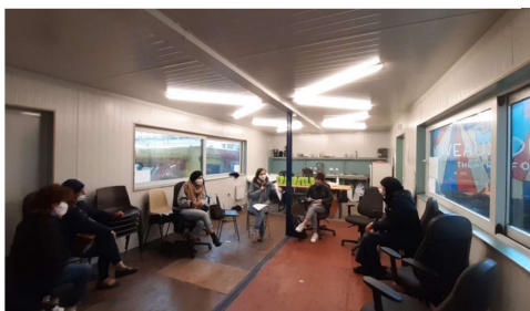
↑ Workshop 2020 Molenwest

>> Les artistes amateurs sont (majoritairement) des femmes, très instruites et jeunes. La participation créative ne dépend pas de l'origine ethnique ou de la situation économique d'une personne. La majorité des artistes amateurs exercent leur hobby dans et autour de la maison où ils vivent, au sein et en dehors du réseau familial et des connaissances. Seule une minorité est soutenue pour son hobby par un club, une académie ou une autre organisation.