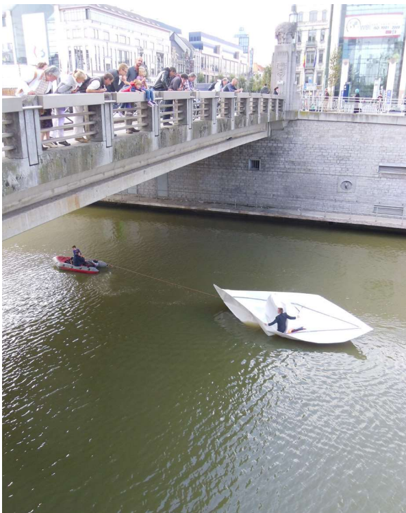
↑ Intervention artistique, Festival Kanal

La culture et ses pratiques sont des éléments qui soudent les êtres humains, à plus forte raison à l'échelle d'un quartier. Or, actuellement, plus de 100 projets publics et privés sont en cours à Bruxelles, ce qui va modifier tant la morphologie urbaine des quartiers que les populations qui y résident. A ce titre, la culture mérite d'autant plus d'être prise en compte et, ce tout au long de la mise en œuvre des programmes de développement urbain en cours ou à venir.