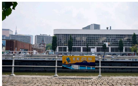
↑ Citroën canal

L'étude a été menée sur le périmètre reprenant le Molenbeek Historique, le Quartier Maritime, la Gare de l'Ouest, le Vieux Laeken Est et le Quartier Nord. Depuis plus d'un siècle, ces quartiers ont connu de fortes évolutions à travers des phases d'industrialisation, d'immigration et de « régénération » via la vie culturelle. Ces différentes dynamiques ont façonné l'espace et sa population, laquelle est socialement et culturellement diversifiée.