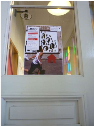
↑ Communication Culturelle ◦ ULiège

Parallèlement, l'analyse a fait émerger une demande en espaces plus sûrs et plus accessibles, en particulier pour les jeunes.