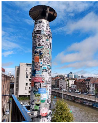
↑ Communication Culturelle Ephémère ◦ ULiège