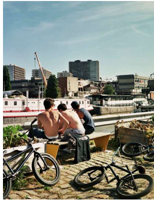
↑ Jeunes sur le quai des Matériaux

« Pour les jeunes, il n'y a plus assez de parcs et d'activités et c'est vraiment un très grand souci. »